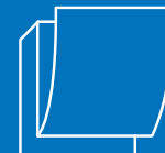
PACCO / Z-FOLD