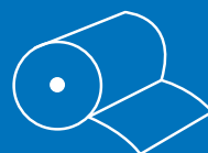
ROTOLO / ROLL

Every Trademark or Registered Mark is property of the respective owner. The actual products may differ from here shown. The Manufacturer has the right to modify the products without prior notice.