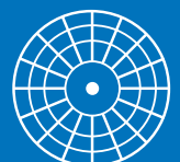
DISCO / DISK